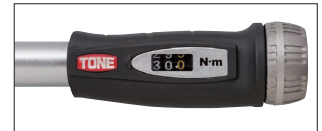
デジタル表示部分 (特許・意匠取得済)