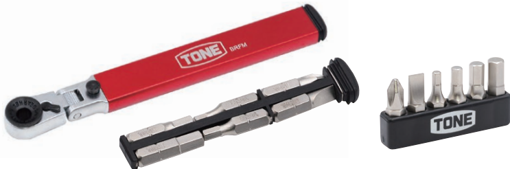
ビット収納イメージ