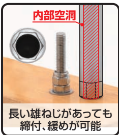
長い雄ねじがあっても締付、緩めが可能