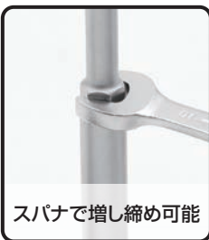
スパナで増し締め可能