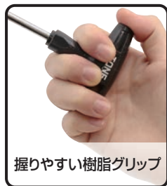
握りやすい樹脂グリップ