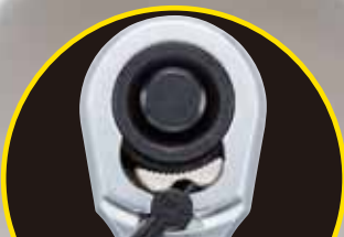
クサビ式 ギアとカムの歯が 8段噛合う新機構