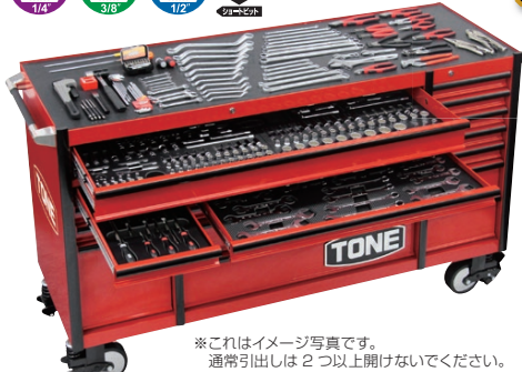
※これはイメージ写真です。通常引出しは2つ以上開けないでください。