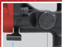
回転方向 切替レバー