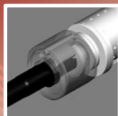
ピンレスハンマー